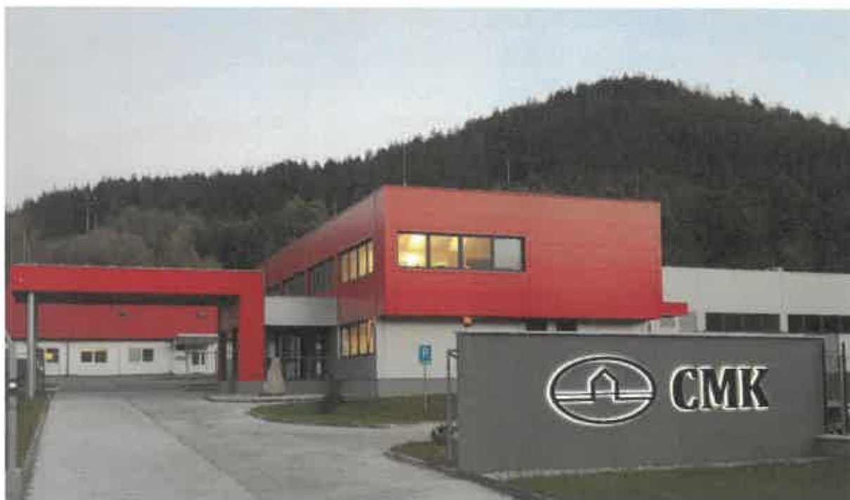
CMK, s.r.o. Žarnovica

Vypracovaná v zmysle § 15, ods. 1 až 4, zákona č. 128/2015 Z. z. o prevencii závažných priemyselných havárií a o zmene a doplnení niektorých zákonov a vyhlášky MŽP SR č.198/2015 Z. z., ktorou sa vykonávajú niektoré ustanovenia zákona č. 128/2015 Z. z. o prevencii závažných priemyselných havárií a o zmene a doplnení niektorých zákonov.